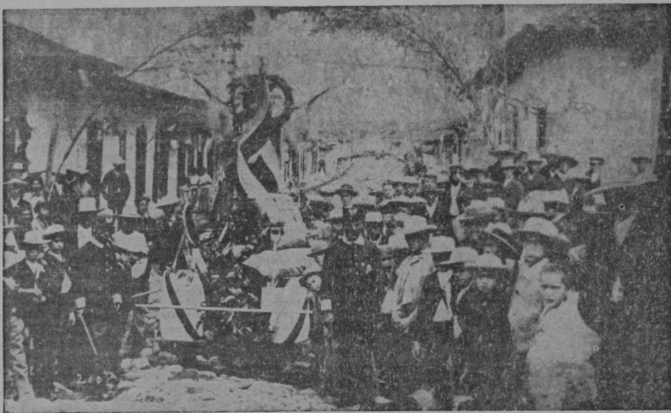
La fotografía presenta la primera exposición de café efectuada en San José por estas fechas hizo ciento un años para fomentar la agricultura y la exportación. El acto se realizó en 1870, ante el entusiasmo de la comunidad josefina, entonces reducida, pero ya consiente del valor enorme del grano de oro..