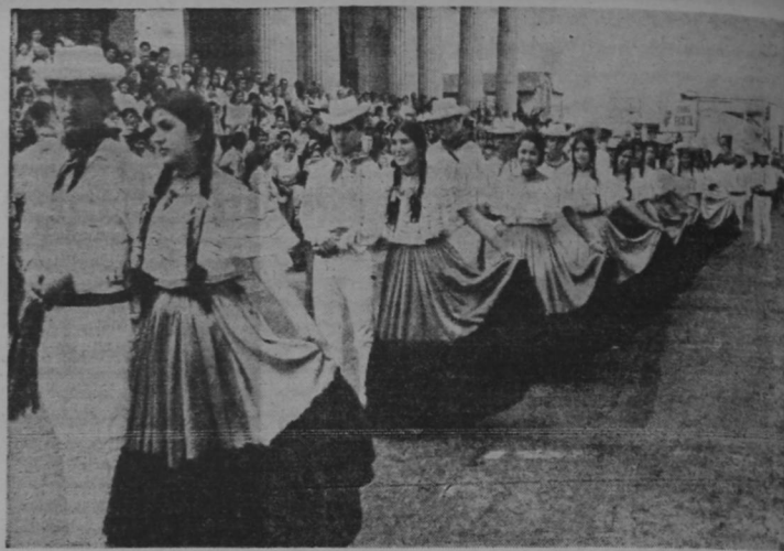
EL PASADO Y EL FUTURO AYER EN LA CAPITAL. — Docenas de parejas juveniles, vistiendo los trajes típicos de Costa Rica, que nos recuerdan el pasado y ejecutando pases de baile de hace medio siglo, mezclaron el pasado y el futuro de la República en hermosa conjunción. El pasado: sus trajes y sus bailes. El futuro: las edificaciones que buscan arosas el cielo yosefine y representan la Costa Rica del siglo XX.