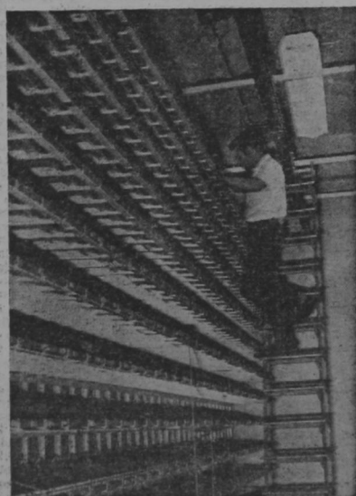
Vista parcial de la ampliación de la central telefónica de San José. Un técnico dedicado a su labor se aprecia en el grabado.

Nuestro país, que lleva a cabo grandes esfuerzos para alcanzar un pleno desarrollo, se ha impuesto como meta en el campo de las telecomunicaciones, a través del ICE, el ambicioso programa de desarrollo que aquí se ha mencionado a grandes rasgos.